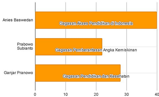
Gambar 2. Gagasan Terbanyak yang Dipilih Responden dalam Indikator Afektif

Pada Gambar 2 responden memilih gagasan calon presiden yang paling mereka sukai. Dalam grafik ini yang paling banyak disukai oleh responden adalah gagasan milik Anies Baswedan tentang akses pendidikan di Indonesia. Lalu diikuti oleh gagasan pendidikan dan kesehatan milik Ganjar Pranowo menjadi gagasan kedua yang disukai berdasarkan jumlah responden survey . Sedangkan gagasan pemberantasan angka kemiskinan milik Prabowo Subianto menjadi gagasan terakhir dari ketiga calon presiden yang disukai berdasarkan jumlah responden survey .